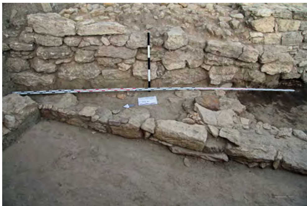
Рис. 5. Ранние постройки, перекрытые крепостной стеной. Вид с запада Fig. 5. Early buildings covered with a fortification wall. Viewed from the west