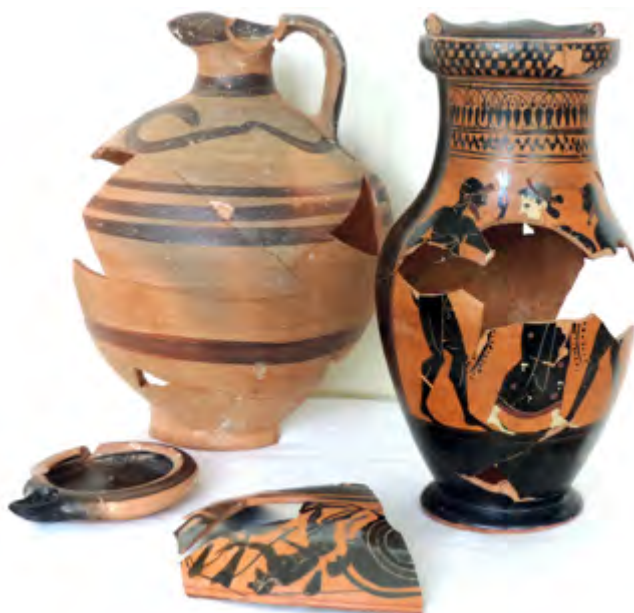
Рис. 4. Чернофигурная аттическая и родосско-ионийская керамика из ям-ботрасов Fig. 4. Black-figured Attic and Rhodes-Ionian pottery from storage pits