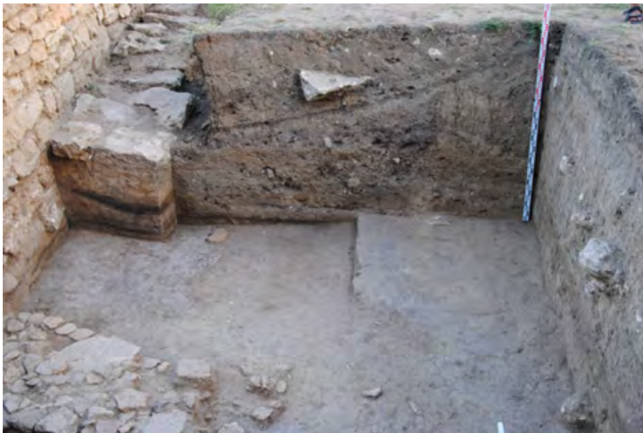
Рис. 2. Два слоя пожара с внешней стороны западной крепостной стены. Вид с севера Fig. 2. Two fire layers at the outer side of the western fortification wall. Viewed from the north