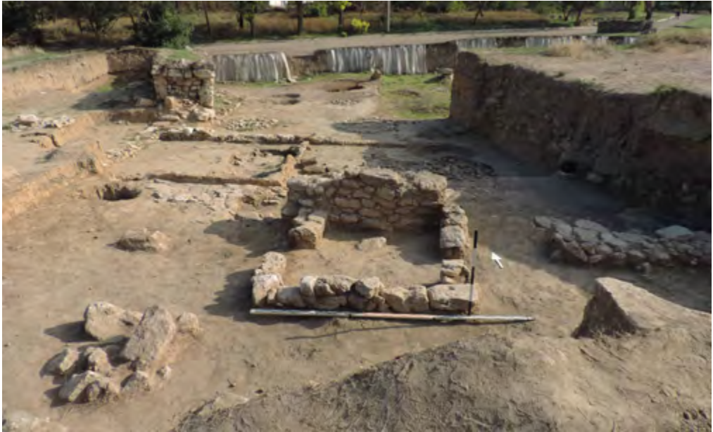
Рис. 6. Постройка СК-IX – святилище Диониса-Гарпократа, вид с юга Fig. 6. The building complex СК-IX, or the temple of Dionysus-Harpocrates, viewed from the south