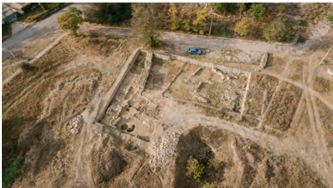
Рис. 3. Южная и центральная части теменоса на раскопе XXVII, вид сверху. Фото 2017 г. Fig. 3. The southern and central temenos areas in the excavation trench XXVII, viewed from above. Photographed in 2017