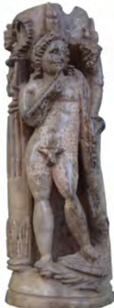
Рис. 7. Изделие из кости с изображением Гарпократа из СК-IX Fig. 7. Worked bone showing Harpokrates from the building complex СК-IX