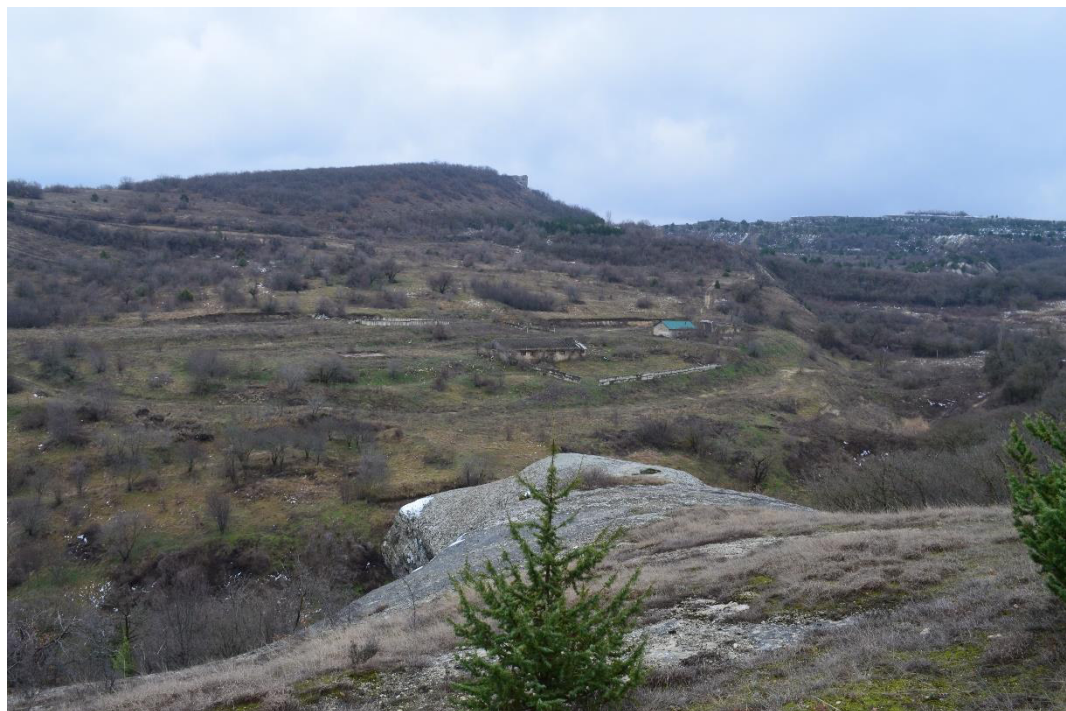
Рис. 8. Современный вид на бывшее с. Балта-Чокрак.

Несмотря на относительное забвение бывшей греческой колонии Балта-Чокрак, проведенная реконструкция ее истории является ярким примером этнической, культурной, хозяйственной жизни Юго-Западного Крыма конца XVIII – XX веков. Вопросам непосредственного изучения исторической географии культурного ландшафта Балта-Чокрака и его отдельных элементов будет посвящена отдельная публикация.