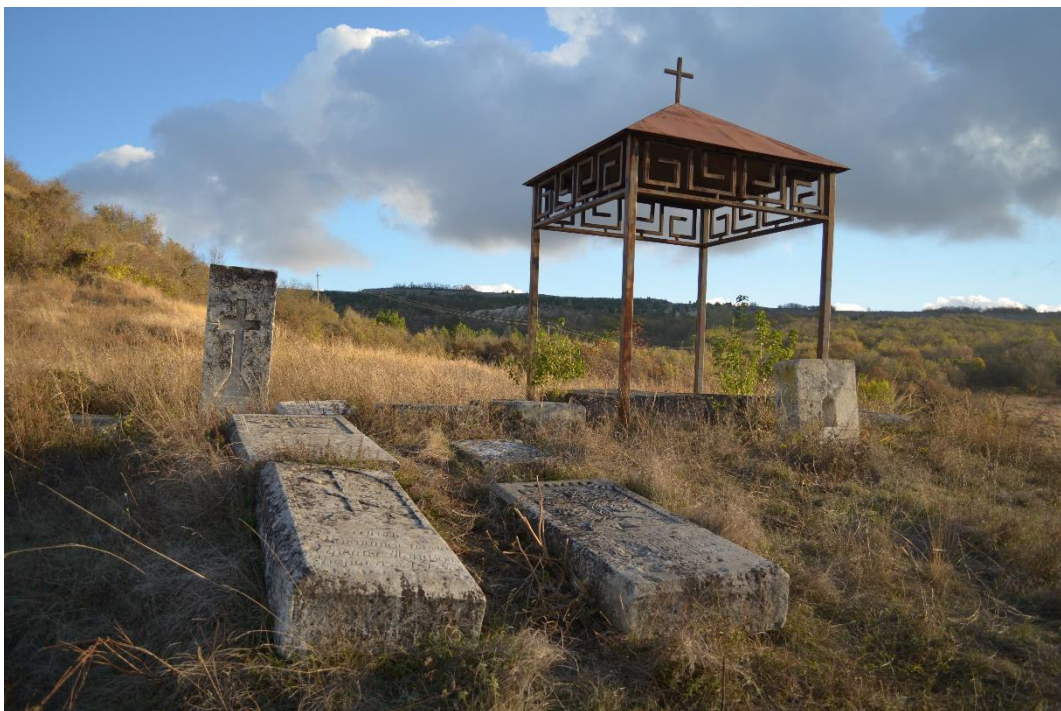
Рис. 5. Участок греческого кладбища с. Балта-Чокрак.