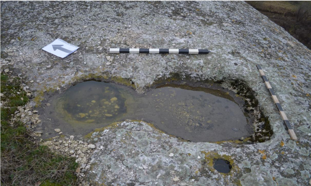
Рис. 1. Скальная виноградодавильня в Балтачокракской балке. Вид с юго-запада.

Об использовании окрестностей Балта-Чокрака в средневековую эпоху известно немного. Осенью 2023 г. в ходе подготовки настоящей публикации на скалистом выступе правого борта Балтачокракской балки была обнаружена виноградодавильня (тарапан) 1 . Подобные памятники В. Е. Науменко и В. К. Ганцев датируют второй половиной IX – первой половиной X вв. [82, с. 97–98] (рис. 1).