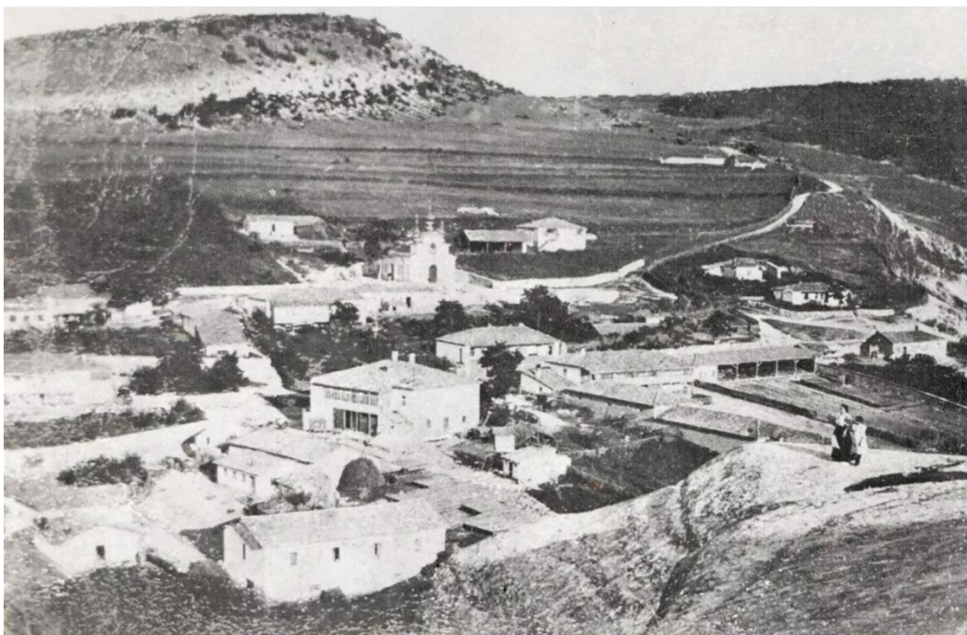
Рис. 7. Вид на с. Балта-Чокрак (фото начала XX в.).

Согласно статистическим данным на 1915 г. в селе Балта-Чокрак отмечалось 28 дворов со смешанным населением в количестве 130 человек приписных жителей и 43 – «посторонних». Во владении было поселян уже около 882 десятин земли, с землёй были 17 дворов и 11 безземельных. В хозяйствах имелось 48 лошадей, 28 волов и 30 коров [88, с. 88]. По всей вероятности, именно на пике своего развития в начале XX в., отмеченного в статистических данных, село Балта-Чокрак было зафиксировано пока на единственной известной фотографии (рис. 7).