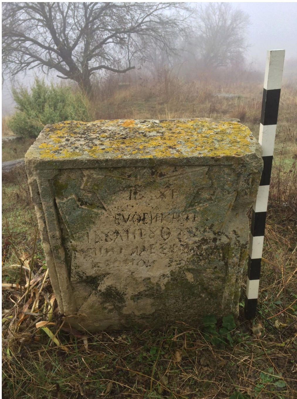
Рис. 6. Надгробие Деспины Алексиади, предположительно перв. пол. XIX в.