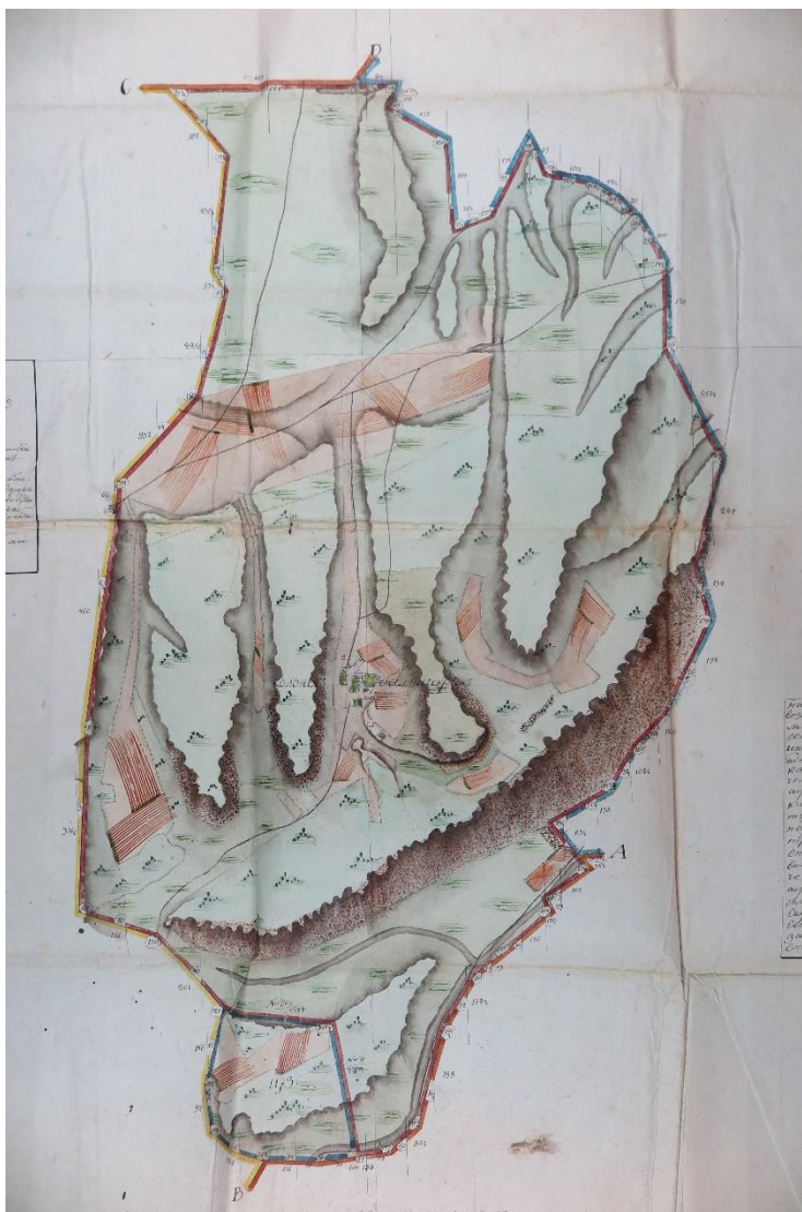
Рис. 4. Культурный ландшафт с. Балта-Чокрак на «Геометрическом специальном плане 1819 года...».

одержимые болезнями разными оканчивая дни свои лишаются вовсе христианского напутствования и самого даже погребения по обряду церкви, рождающиеся же слабые младенцы умирают без крещения» [21, л. 2–5 об.]. В состав балта-чокракского прихода должны были войти также села Бодрак, Улаклы, Большой Хан-Эли, Малый Хан-Эли, Альма-Кермен, Базарчик и окрестные поместья К. Мазгана, Д. Константинова, К. и И. Смирновых [21, л. 6 об.].