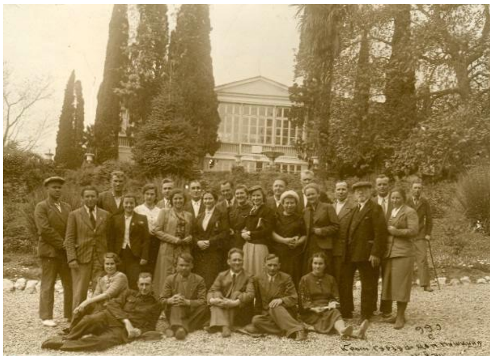
Экскурсанты у Музея А. С. Пушкина в Гурзуфе. Май 1941 г.