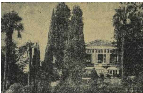
Музей А. С. Пушкина в Гурзуфе. Иллюстрация из газеты «Красный Крым» за 1940 г. [12]

«6 марта в Гурзуфе в Пушкинском доме был открыт музей, посвященный жизни и творчеству великого русского поэта. На митинге по случаю