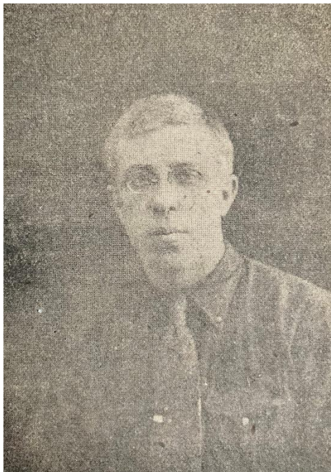
А. В. Поздняков. Портрет из книги «У истоков» [31].

ИСТМОЛа [31, с. 5–9], сказано и «несколько слов об авторе» (сохраним характерное для того времени написание):