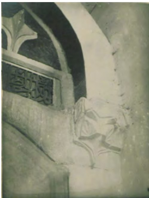
Рис. 19. Мечеть в с. Шейх-Кой. Северный вход. Оформление верхней части западной стороны. Фотоснимок Б. Н. Засыпкина, 1928 г. (ЦГАЛИ. Ф. Р-598. Оп. 1. Д. 493. Л. 5)