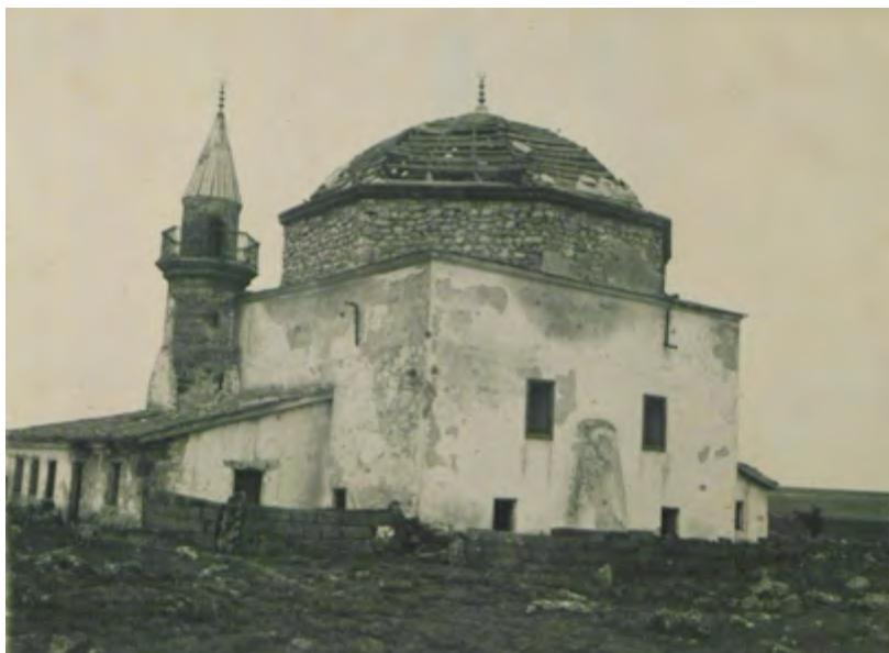
Рис. 11. Мечеть в с. Шейх-Кой. Вид с юго-запада. Фотоснимок Б. Н. Засыпкина, 1928 г. (ЦГАЛИ. Ф. Р-598. Оп. 1. Д. 493. Л. 11)