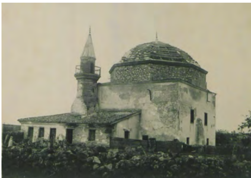
Рис. 10. Мечеть в с. Шейх-Кой. Вид с юго-запада. Фотоснимок Б. Н. Засыпкина, 1928 г. (ЦГАЛИ. Ф. Р-598. Оп. 1. Д. 493. Л. 10)

Fig. 9. Mosque in the village of Sheikh-Koi. Viewed from the north-east. Photographed by B. N. Zasyrkin, 1928 (TsGALI. F. R-598. Op. 1. D. 493. L. 2)