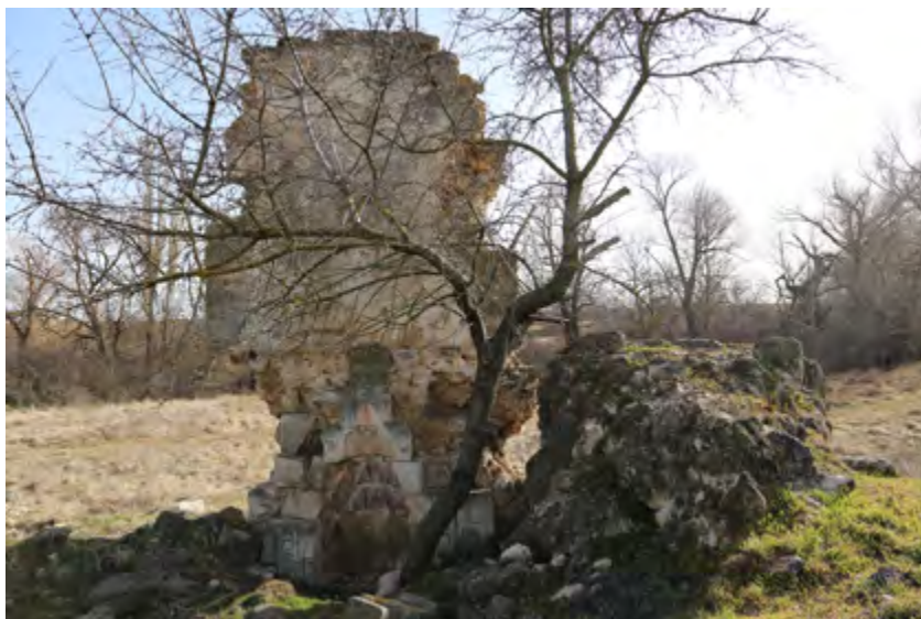
Рис. 3. Симферопольский район, с. Давыдово. Руинированные остатки мечети, сохранившаяся часть южной стены с михрабом и фрагмент купола. Вид с севера. Современное состояние. Фотоснимок Д. А. Ломакина, 2019 г.

Fig. 3. Simferopol district, Davydovo village. Ruined remains of a mosque: the remaining part of the southern wall with mihrab and fragmented dome. Viewed from the north. Current condition. Photographed by D. A. Lomakin, 2019