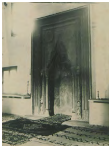
Рис. 14. Мечеть в с. Шейх-Кой. Михраб. Фотоснимок, 20-е гг. XX в. (ЦГАЛИ. Ф. Р-598. Оп. 1. Д. 493. Л. 9)

Fig. 13. Mosque in the village of Sheikh-Koi. Upper part of the minaret. Photographed by B. N. Zasyrkin, 1928 (TsGALI. F. R-598. Op. 1. D. 493. L. 3)