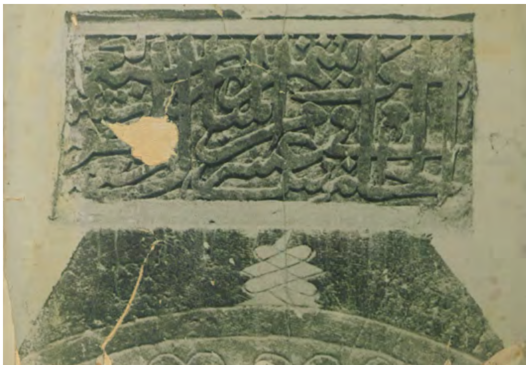
Рис. 21. Мечеть в с. Шейх-Кой. Западный вход. Верхняя часть с надписью и датой 760 г. х. (1358 г). Фотоснимок Б. Н. Засыпкина, 1928 г. (ЦГАЛИ. Ф. Р-598. Оп. 1. Д. 493. Л. 15)

Fig. 21. Mosque in the village of Sheikh-Koi. Western entrance. Upper area with the inscription and the date 760 AH (1358 AD). Photographed by B. N. Zasyrkin, 1928 (TsGALI. F. R-598. Op. 1. D. 493. L. 15)