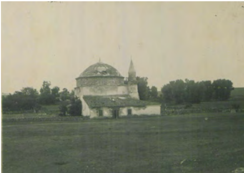
Рис. 8. Мечеть в с. Шейх-Кой. Вид с севера. Фотоснимок Б. Н. Засыпкина, 1928 г. (ЦГАЛИ. Ф. Р-598. Оп. 1. Д. 493. Л. 4)