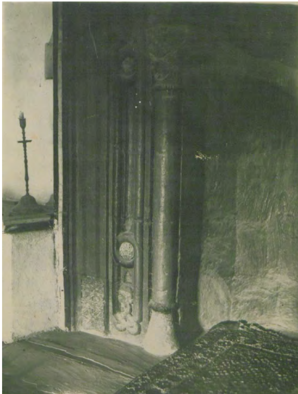
Рис. 15. Мечеть в с. Шейх-Кой. Оформление нижней части михраба. Фотоснимок Б. Н. Засыпкина, 1928 г. (ЦГАЛИ. Ф. Р-598. Оп. 1. Д. 493. Л. 8)