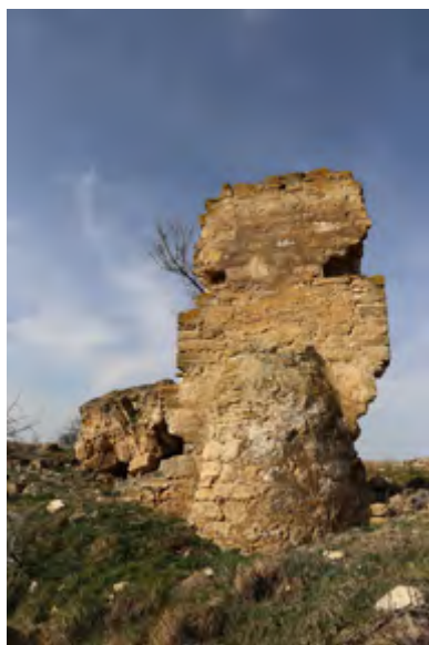
Рис. 2. Симферопольский район, с. Давыдово. Руинированные остатки мечети, сохранившаяся часть южной стены и фрагмент купола. Вид с юга. Современное состояние. Фотоснимок Д. А. Ломакина, 2019 г.