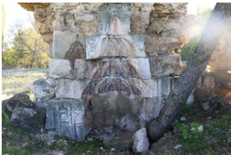
Рис. 4. Симферопольский район, с. Давыдово. Руинированные остатки мечети, михраб. Современное состояние.

Fig. 3. Simferopol district, Davydovo village. Ruined remains of a mosque: the remaining part of the southern wall with mihrab and fragmented dome. Viewed from the north. Current condition.