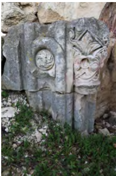
Рис. 5. Симферопольский район, с. Давыдово. Руинированные остатки мечети, фрагмент декоративного оформления восточной части михраба. Современное состояние. Фотоснимок Д. А. Ломакина, 2019 г.