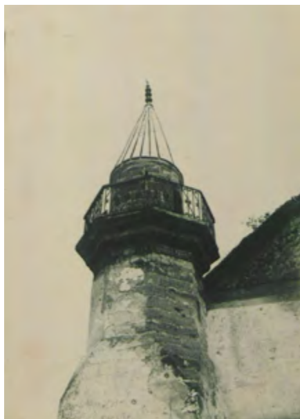
Рис. 13. Мечеть в с. Шейх-Кой. Верхняя часть минарета. Фотоснимок Б. Н. Засыпкина, 1928 г. (ЦГАЛИ. Ф. Р-598. Оп. 1. Д. 493. Л. 3)

Fig. 13. Mosque in the village of Sheikh-Koi. Upper part of the minaret. Photographed by B. N. Zasyrkin, 1928 (TsGALI. F. R-598. Op. 1. D. 493. L. 3)