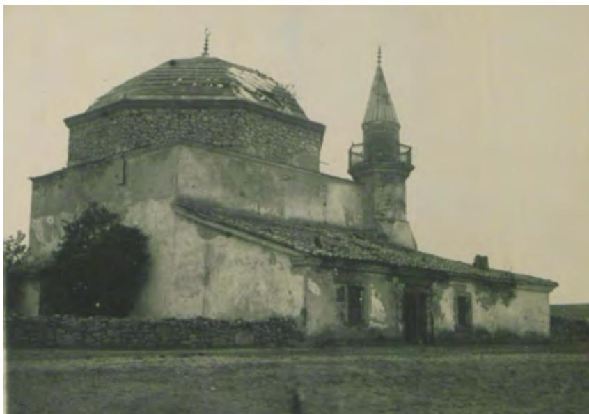
Рис. 9. Мечеть в с. Шейх-Кой. Вид с северо-востока. Фотоснимок Б. Н. Засыпкина, 1928 г. (ЦГАЛИ. Ф. Р-598. Оп. 1. Д. 493. Л. 2)

Fig. 9. Mosque in the village of Sheikh-Koi. Viewed from the north-east. Photographed by B. N. Zasyrkin, 1928 (TsGALI. F. R-598. Op. 1. D. 493. L. 2)