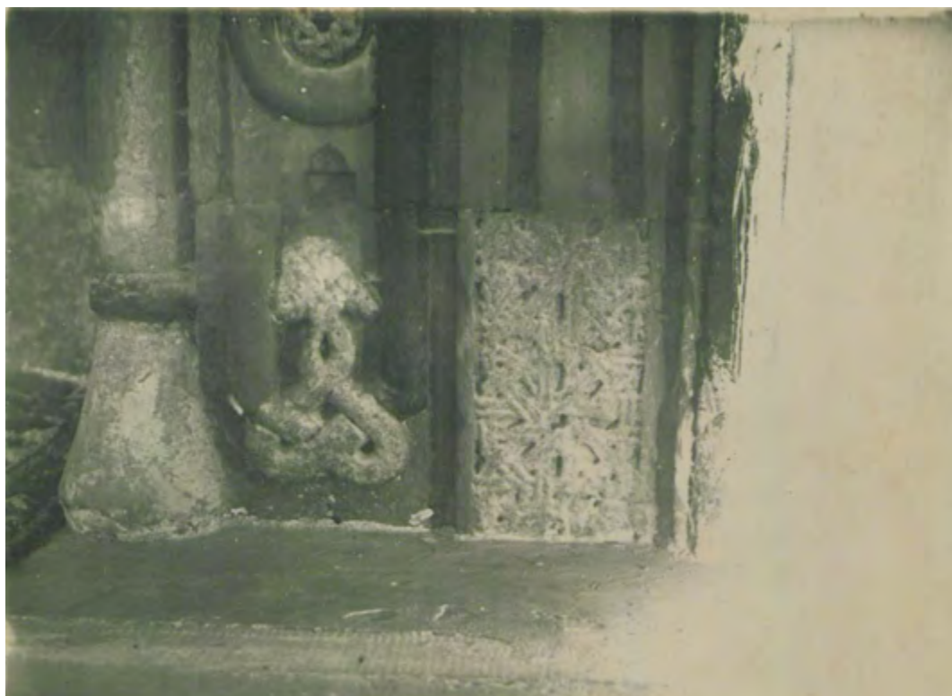
Рис. 16. Мечеть в с. Шейх-Кой. Оформление нижней части михраба. Фотоснимок, 20-е гг. XX в.