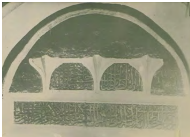
Рис. 18. Мечеть в с. Шейх-Кой. Северный вход. Верхняя часть с надписью. Фотоснимок, 20-е гг. XX в.