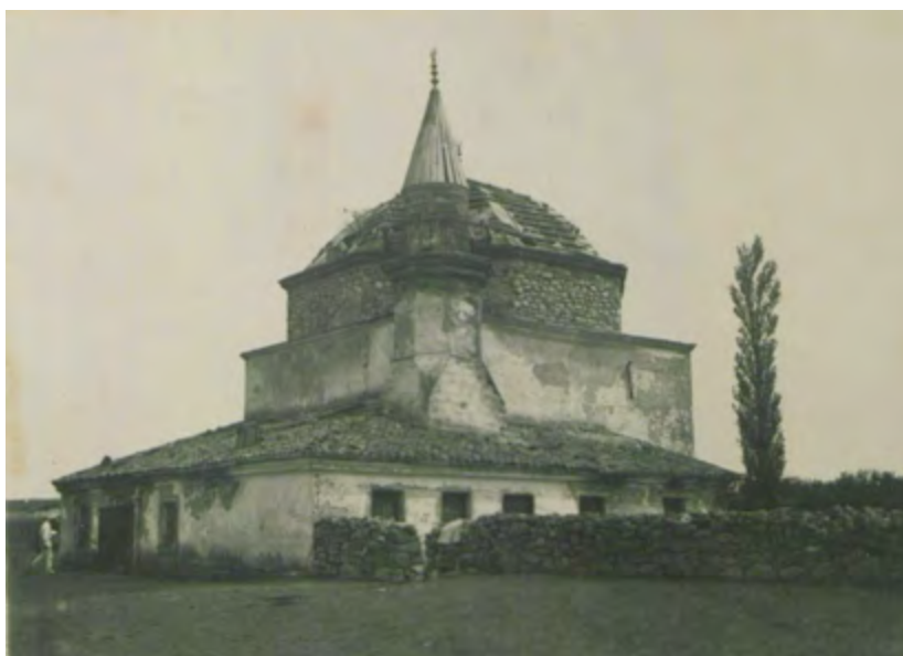
Рис. 12. Мечеть в с. Шейх-Кой. Вид с северо-запада. Фотоснимок Б. Н. Засыпкина, 1928 г. (ЦГАЛИ. Ф. Р-598. Оп. 1. Д. 493. Л. 12)