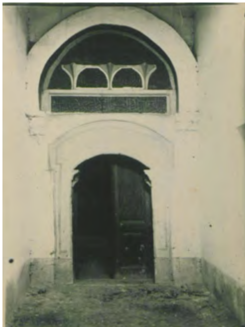
Рис. 17. Мечеть в с. Шейх-Кой. Северный вход. Фотоснимок Б. Н. Засыпкина, 1928 г. (ЦГАЛИ. Ф. Р-598. Оп. 1. Д. 493. Л. 7)