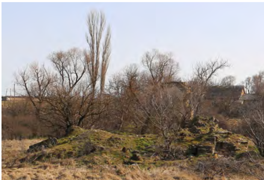
Рис. 1. Симферопольский район, с. Давыдово. Руинированные остатки мечети. Вид с северо-запада. Современное состояние. Фотоснимок Д. А. Ломакина, 2019 г.