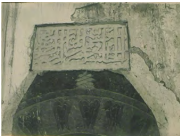
Рис. 20. Мечеть в с. Шейх-Кой. Западный вход. Верхняя часть с надписью и датой 760 г. х. (1358 г.). Фотоснимок, 20-е гг. XX в. (ЦГАЛИ. Ф. Р-598. Оп. 1. Д. 493. Л. 6)