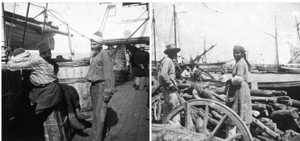
Рис. 7, 8. В Ялтинском порту (фото начала XX в.)