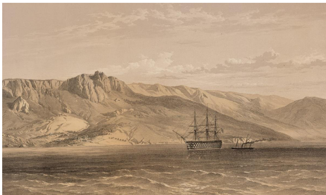
Рис. 4. Дворец князя М. С. Воронцова близ Ялты на Южном побережье Крыма (худ. У. Симпсон)

П. И. Иваненко с нижними чинами кордонов №№ 39, 40, 41 и 42, оставив все имущество и фураж, но сумев забрать с собой оружие и казенную амуницию, закрепился на Алуштинском кордоне № 42. Нижние чины Таврической полубригады пограничной стражи Байдарского, Ласпинского, Форосского, Мухалатского, Кикинеизсаго и Алушкинского постов с началом высадки неприятеля в Ялте оказались отрезанными от основных сил, вследствие чего вместе со штабе-капитаном И. В. Спаковским вынуждены были отступить через горы, в направлении Бахчисарая, а оттуда – в Симферополь, в место расположения штаба полубригады. Высадившийся в Ялте в ночь с 24 на 25 сентября десант союзников занимался «грабежом домов, рогатого скота, винограда и виноградного вина и т. п., при содействии татар <...> ограбили магазин с казенным провиантом, у князя Воронцова антрацитный уголь, у Потоцкого набрали вина и разбивали дома» [58, с. 64–65].