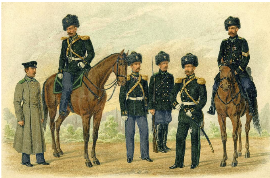
Рис. 6. Обмундирование офицеров и солдат пограничной стражи, установленное в 1864 г.

топления дельфиньего жира. Как сообщалось в донесениях пограничной стражи, турецко-подданные повадились «делать разные беспорядки по берегам, а также перевозить на своих судах в Турцию беглых татар». Законодательные поправки были направлены прежде всего на воспреещение иностранцам заниматься рыболовным промыслом в российских территориальных водах близ Крымского полуострова, причем Министерство финансов заявило о необходимости усилить средства для таможенного надзора, поскольку иностранные суда безнаказанно уклонялись от соблюдения установленных таможенных формальностей [57, с. 139–140].