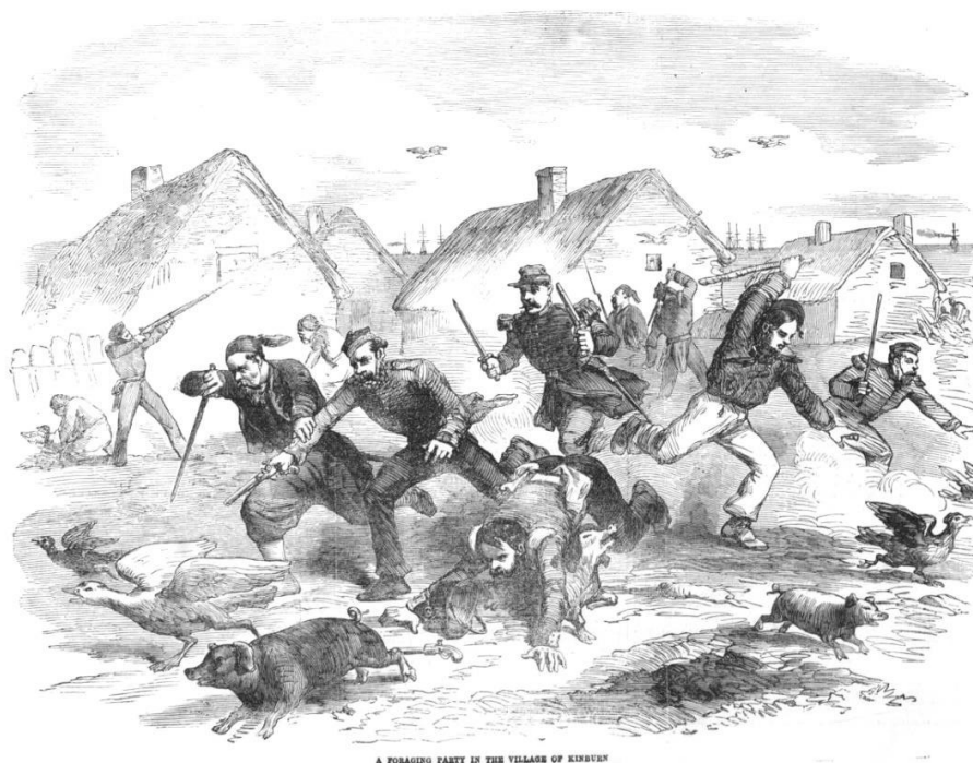
Рис. 5. Фуражиры союзников в Кинбурне (с гравюры Дж. А. Кроу)

чины кордона № 54 вместе с донскими казаками находились в оцеплении на берегу [58, с. 107–108].