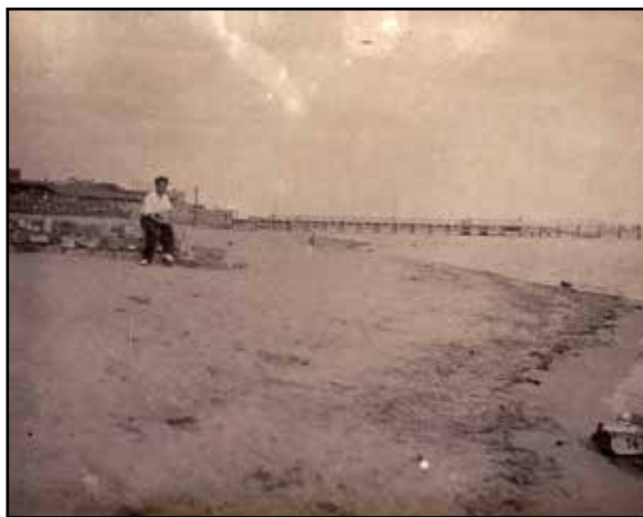
Рис. 4. П. Н. Шульц у берега Сакской пересыпи. 1934 г. [НА ИАК РАН, ф. Л-9, оп. 3, д. 35, л. 44]

Fig. 3. Ia. G. Blagodarnyi. Late-1930s. Photograph from V. L. Blagodarnyi's family archive