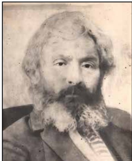
Рис. 1. Я. Г. Благодарный. Середина 1930-х гг.

Fig. 1. Ia. G. Blagodarnyi. Mid-1930s.